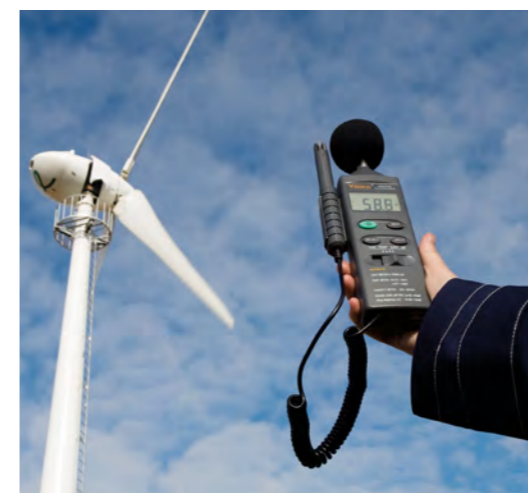
Nach der Abnahmemessung werden weitere Lärmmessungen nur aus besonderem Anlass oder bei Beschwerden aus der Bevölkerung durchgeführt.

Wird festgestellt, dass die Allgemeinheit oder die Nachbarschaft nicht ausreichend vor schädlichen Umwelteinwirkungen oder sonstigen Gefahren, erheblichen Nachteilen oder erheblichen Belästigungen geschützt ist, soll die Genehmigungsbehörde sogenannte nachträgliche – das heißt nach Erteilung des Genehmigungsbescheides – Anordnungen treffen (§ 17 BImSchG).